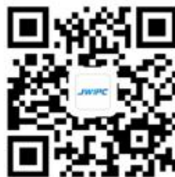
JWIPC Official Website